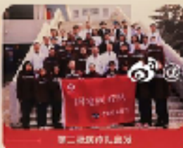
第二批医疗队出发