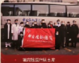
第六批医疗队出发