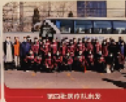
第四批医疗队出发