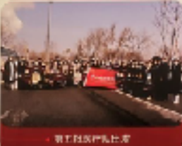
第五批医疗队出发