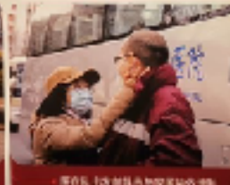
第八批医疗队出发

医院启动应急机制，1月3日起开始布置院内防控，1月10日启动三级防控战略，构建全院内无死角的防控体系网，作为抗击疫情的重要屏障。1月21日成立中日混血院前新冠团队领导小组，腾挪、改造病房做冷链防控专用，规范会诊、转运流程，增加核酸检测频次。