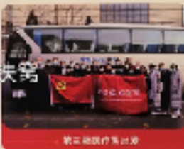
第三批医疗队出发