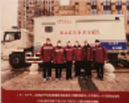
第七批医疗队出发